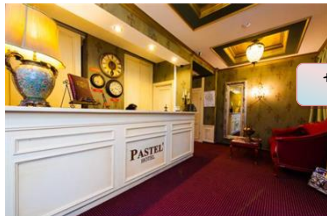
セントラル アリーナ

ご入金後の取消・名前や日付の変更は一切出来ません。ワールドカップ期間中のため特別条件です。