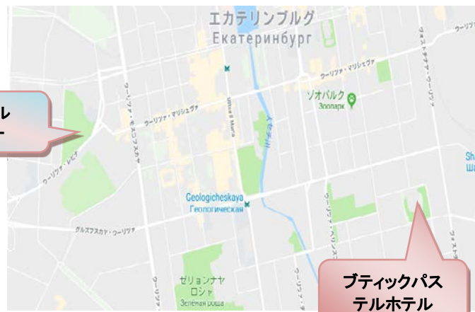
ブティックパス テルホテル