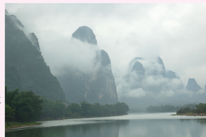
幻想的な漓江の山並み

今から半世紀前の1972年、日中国交回復して、1980年に入ると、中国への旅行熱が大変高まりました。日本の雅やかな風景の佇まいとは全く違う、スケールの大きな大自然とまさしく中国4千年の歴史が織りなす風景は日本人の旅心を大いに刺激したものでした。その代表格が、桂林と陽朔に重畳と続く奇岩奇峰の山並みで、どこか懐かしい山水画の故郷を想わせる風景で、NHKを中心とするテレビでたくさん紹介されました。その意味では、古くて新しい中国再発見の場所でもあります。桂林と陽朔を繋ぐ漓江クルーズを軸に、5日間たっぷりと山水画のお正月をのんびりと過ごす旅となります。