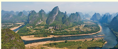
桂林の代表的な風景

注2:漓江クルーズは、川の水位により乗船場所及び下船場所が変更になる場合がございます。