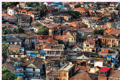
コロンス島の町並み